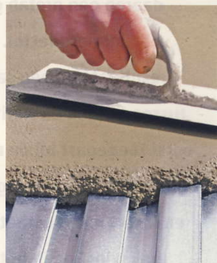
De nieuwe betonmortel is lichter te mengen, lichter af te reien en makkelijker te verdichten.

Remix Droge Mortel b.v. heeft onder de merknamen Remix en Sakrete een kant-en-klare betonmortel op de markt gebracht. Een product dat 30 procent lichter is en tegelijkertijd voldoet aan de sterkteklasse LC25/28. Bovendien is het de eerste lichtgewicht betonmortel gekwalificeerd met het Komo-keur.